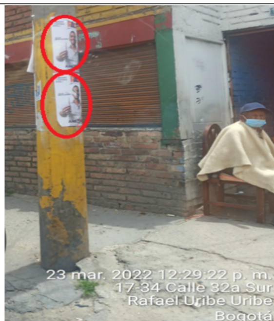
Dos (2) elementos tipo AFICHE Y/O CARTEL con publicidad política, instalados en el mobiliario público, sobre la DG 32B calzada sur