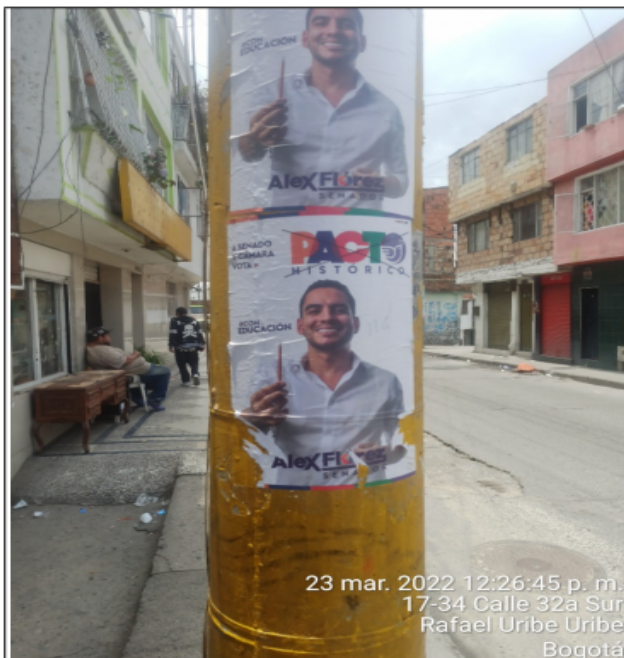
Dos (2) elementos tipo AFICHE Y/O CARTEL con publicidad política, instalados en el mobiliario público, sobre la DG 32B calzada sur